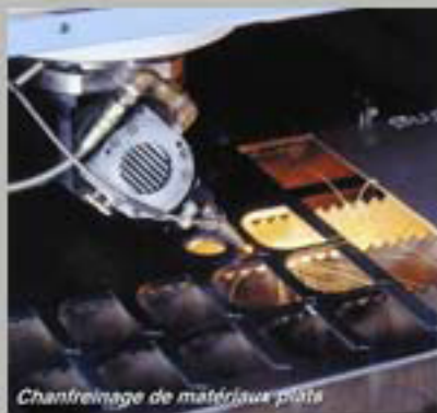
Chanfreinage de matériaux plats