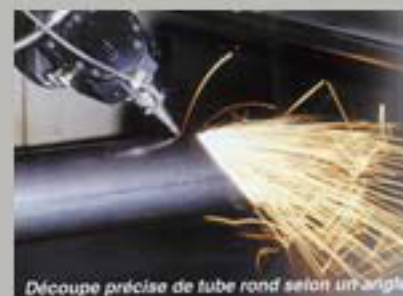
Découpe précise de tube rond selon un angle