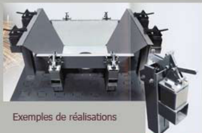
Exemples de réalisations