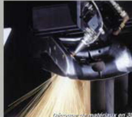
Découpe de matériaux en 3D