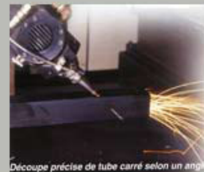
Découpe précise de tube carré selon un angle