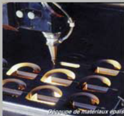
Découpe de matériaux épais