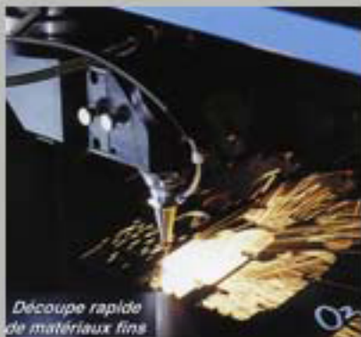
Découpe rapide de matériaux fins